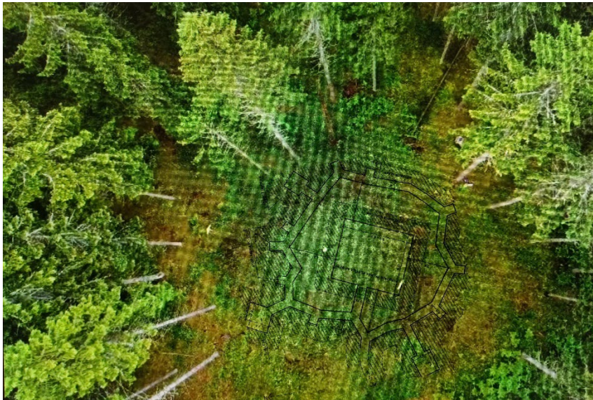
Indāna Grāvelsona bunkurs

Papildus meža bunkuriem, Strods savā darbā raksturojis arī partizānu izmantotās slēptuves. Šīs slēptuves tika veidotas dažādās civilajās ēkās: zem dzīvojamo māju grīdām, šķūņos, klētīs un citās mazāk pamanāmās vietās.